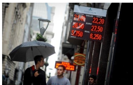
Una casa del microcentro porteño, el viernes pasado.