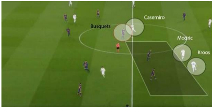
Las claves tácticas del Barça - Madrid (AD)

En base al hecho descrito en el primer punto, el Barça fue muy superior al Real Madrid en los 15/20 minutos iniciales. Pero los madridistas pasaron de sufrir a sentirse cómodos en el terreno de juego. Y los hicieron de la mano de sus dos interiores. Toni Kroos y Luca Modric entraron en contacto sólo 20 veces en el balón (15+5) en el primer cuarto de hora. A partir de ahí ambos empezaron a leer mejor las zonas donde recibir. Ambos pasaron a apartarse del balón para recoger posteriormente en posiciones más libres. Así huyeron de la presión conjunta Busquets-Rakitic . Dado que, los dos azulgranas presionaron en paralelo, la maniobra de separarse siempre dejó a uno de los dos solo (especialmente Toni Kroos). El Madrid pasó de un 38% de cuota de balón en el 19' a casi un 46% en el minuto 40. A la media parte sus intervenciones ya habían subido a 72 (42+30) y, hasta que ambos coincidieron en el campo, fueron los dos jugadores con mayor participación madridista.