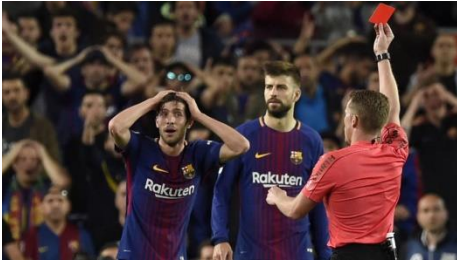
Sergi Roberto, en el momento que es expulsado durante el clásico