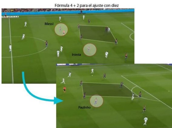
Las claves tácticas del Barça - Madrid

La expulsión de Sergi Roberto obligó a una reestructuración rápida del Barça. Y aunque la banda derecha azulgrana llevó el peso atacante hasta entonces, Valverde lo hizo a la manera más lógica relevando a Coutinho por Semedo . De esta manera, retocó los objetivos tácticos iniciales por otros más conservadores como pedía la nueva situación. El equipo azulgrana se dispuso en un 4-3-2 con dos partes muy diferenciadas. Por un lado, un caparazón con el cuadrado central Piqué-Umtiti-Busquets-Rakitic . Por otra parte y en una situación más alejada, Luis Suárez y Leo Messi quedaron arriba para realizar una presión tenue y claramente seleccionada. Un equipo azulgrana que se había desenvuelto alto hasta el medio tiempo, realizó un paso atrás para atenuar el déficit de jugar con diez.