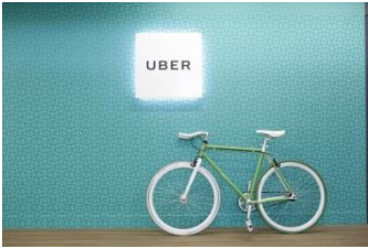
Imagen del interior de la sede de Uber en Madrid.

La plataforma Uber ha activado una nueva opción para que los usuarios que lo deseen puedan dejar propina a través de la propia aplicación, lo que supone un nuevo paso adelante en el mercado de la movilidad urbana con el fin de fidelizar a los conductores.