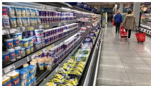
Góndolas con nuevos precios.

Las grandes cadenas y los autoservicios aseguran que sus proveedores ajustaron precios con la excusa de los movimientos del dólar y las tarifas.