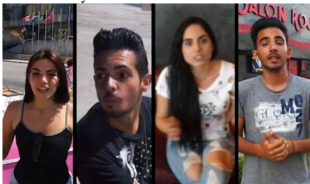
Youtubers, los ojos libres de Cuba EL MUNDO (Vídeo)

La plataforma web para compartir vídeos convierte en celebridades a decenas de jóvenes cubanos