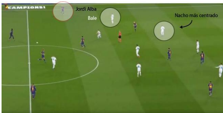
Las claves tácticas del Barça - Madrid (AD)

Lo más destacable fue la misión que Zidane encomendó a Gareh Bale . El galés se encargó de ir prácticamente al hombre con el lateral azulgrana. Tanto fue así que la composición defensiva de los madridistas sacó a Nacho de banda para ubicarlo en una zona más centrada y así evitar el cara a cara exterior. La apuesta salió, ya que Jordi Alba no tuvo el impacto que acostumbra a tener. El lateral únicamente intervino en 54 ocasiones (el séptimo jugador azulgrana) cuando acostumbra a hacerlo bastante más. Eso sí, la modalidad restó juego entre líneas a los madridistas.